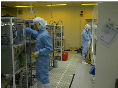
MEMS 初期試作ライン (20mm 角ウエハ) 乗り合いウエハ (16 社)