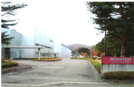
(株)アドバンテストコンポーネント