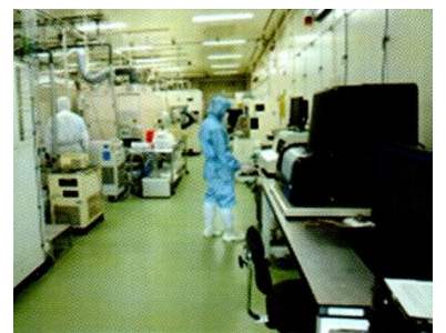
産総研 集積マイクロシステム研究センター