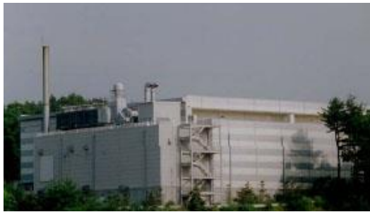
試作コインランドリー (西澤センター内)