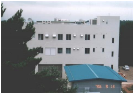
マイクロナッシング研究教育センター (MNC)