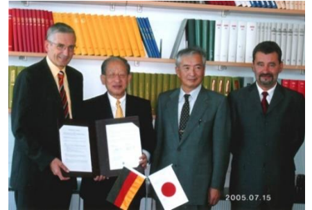
フラウンホーファー研究機構・仙台市協定 (2005)