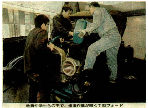
教員や学生らの手で、修復作業が続くT型フォード