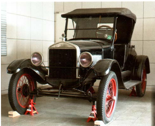
T型フォード (1908年-1927年 1500万台)