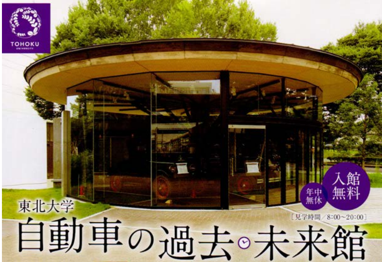
(工学研究科キャンパス東端)