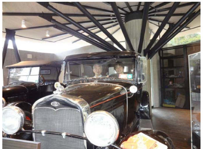
A型フォード (1927年-1931年 400万台)