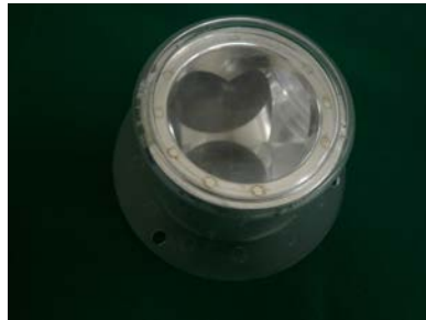
コーナークューブ