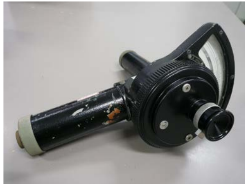
線条消去形光高温計