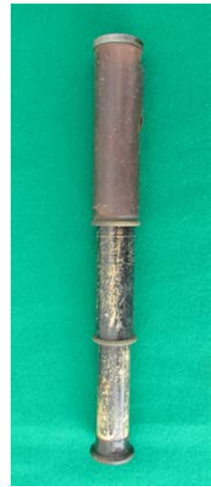
初期の生物顕微鏡 オリンパスの顕微鏡 1号機(複製) 携帯形顕微鏡[1] 望遠鏡(1930年代)[1]