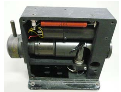
ゴーレーセル (気体の熱膨張による赤外線光の検出)