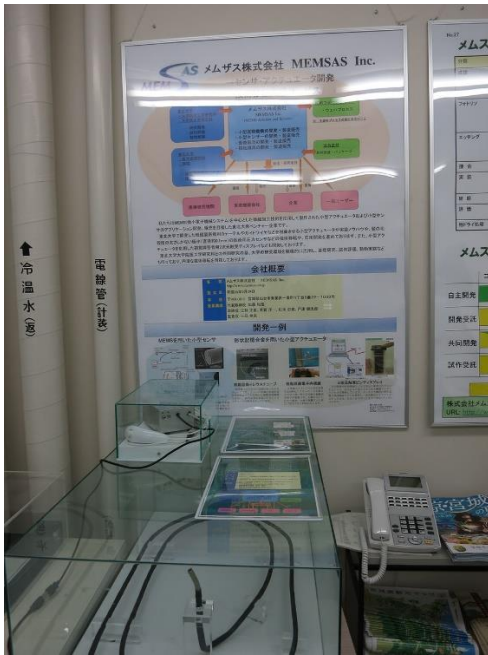
G. メムガス(株) (低侵襲医療)