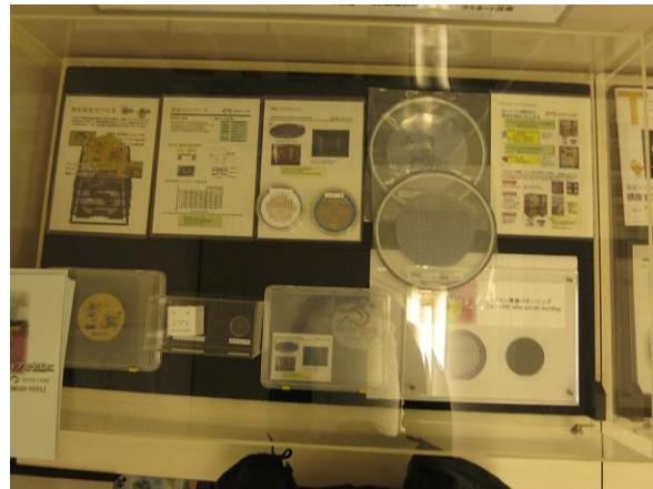
J. MEMS コア(株)の製品例