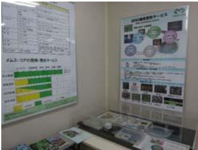
I. MEMS コア(株) (MEMS の受託開発)