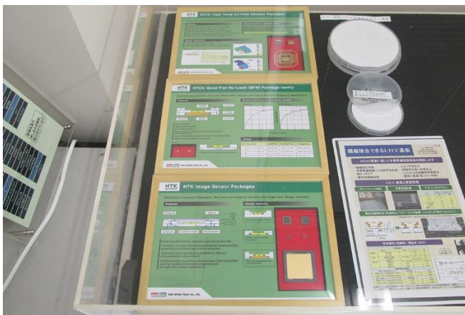
C. 実装関係製品展示(田中貴金属、日本特殊陶業、ニッコー)