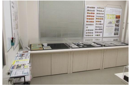
A. 入り口から見た内部