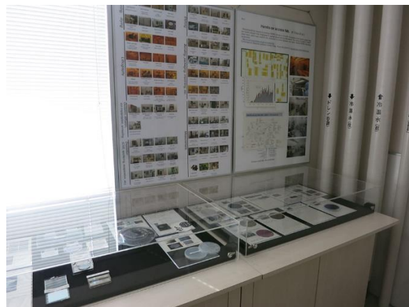
D. 試作コインランドリ関係展示