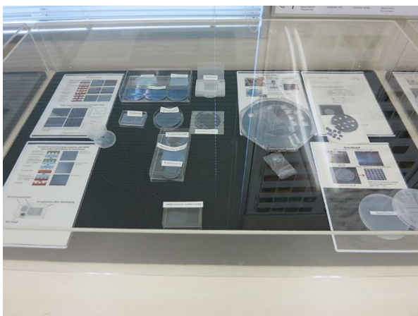
E. ナノインプリント、サンドブラスト加工、ウォーターレーザ加工