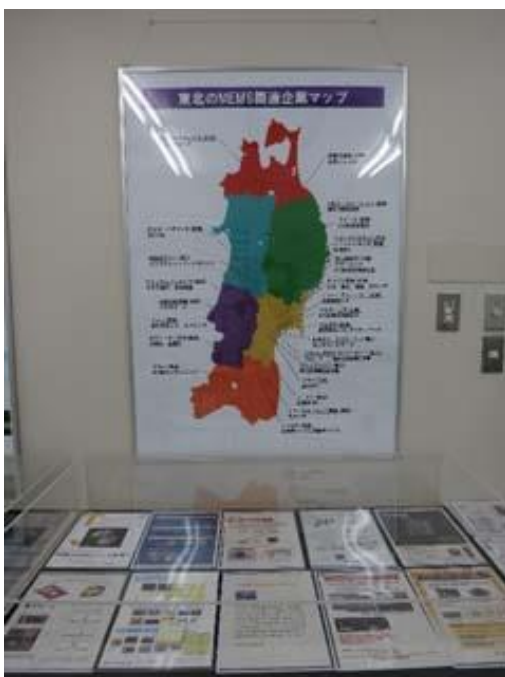
K. 東北の MEMS 関連企業マップ