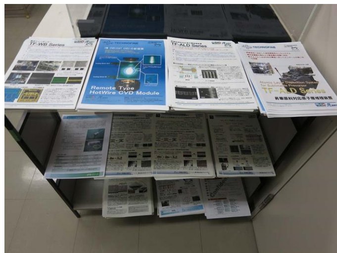
L. 開発した装置(ALD、接合、CATCVD)の製品化 (株)テクノファイン