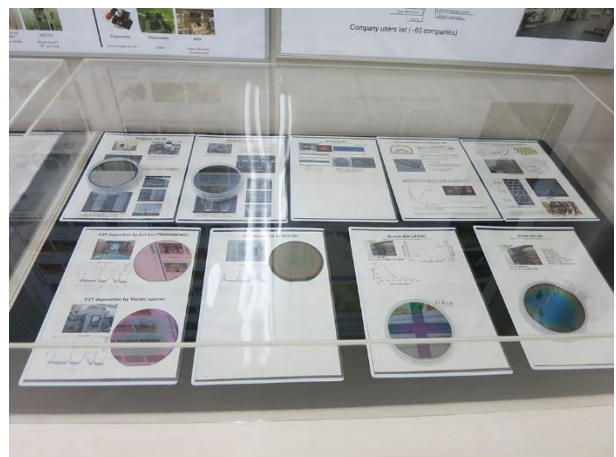
F. 試作コインランドリの各工程のウェア