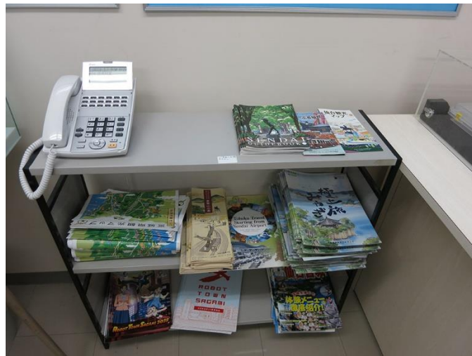
H. 仙台市関係の観光案内